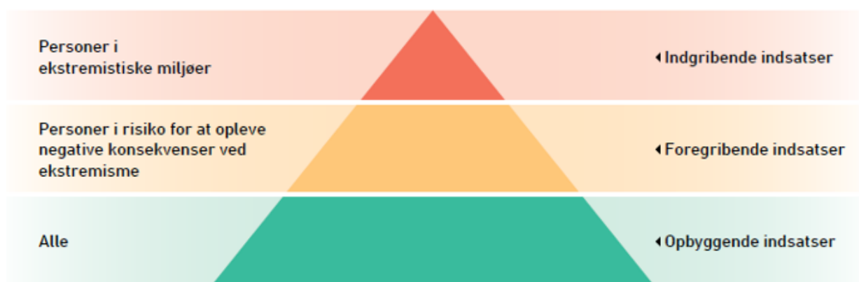
Figur 1. Forebyggelsestrekanten