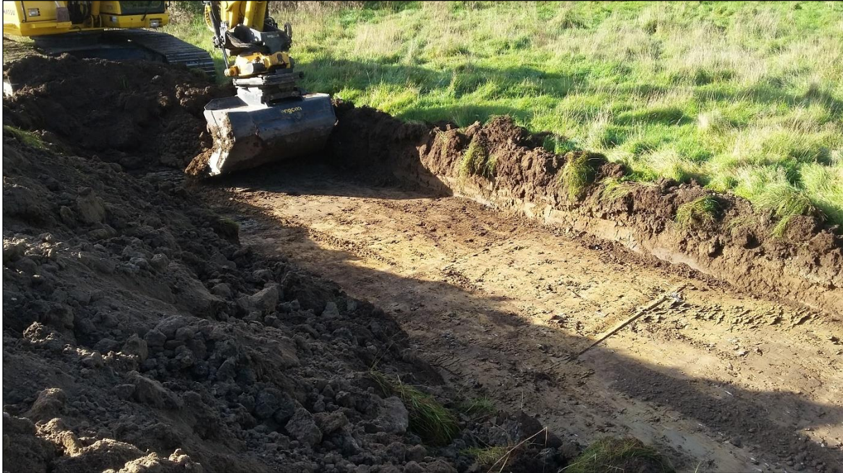
Figur 4: Undergrunden bestod af let sandet ler, flere steder med mange sten og indslag af grus.

Kærsmindeområdet ligger på et plateau, der mod vest skråner let ned mod Oust Møllebæk. Undergrunden bestod af let sandblandet ler med en del sten. De fritlagte grøfter blev meget fedtede og glatte i vådt vejr.