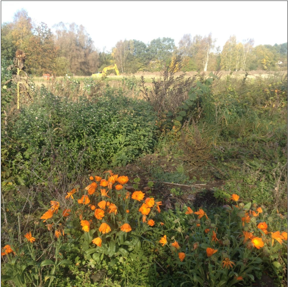
Figur 6. Gravemaskinen bag ved de blomster, der stadig stod i nyttehaverne i efteråret.

Der blev ikke registreret anlæg af arkæologisk interesse ved forundersøgelsen på Kærsmindbadet, så der skal ikke foretages en egentlig udgravning på området.