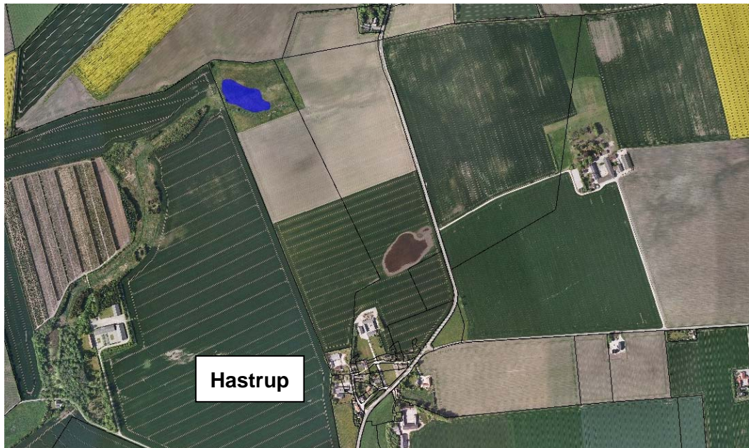
Billed 4.1 Det fremtidige regnvandsbassins omtrentlige størrelse og placering vist med blå.